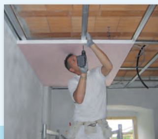
Sistema Climalife Riscaldamento e raffreddamento a soffitto e parete