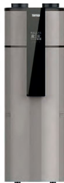
TWMMBS 2203 J TWMMBS 2303 J