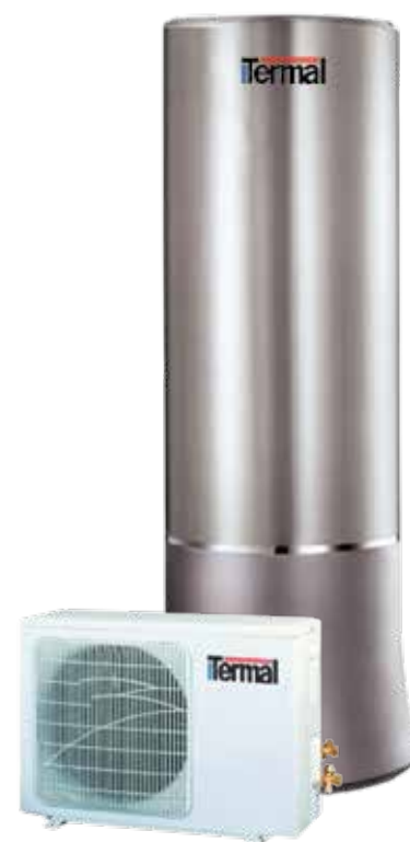
TCDGS 301 A

* Secondo EN 16147. Valori di COP calcolati con aria aspirata a 7° C.